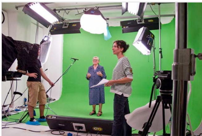
Riprese video su limbo dipinto in chromakey greenscreen

Per le riprese in chromakey greenscreen forniamo fondali in carta, in stoffa oppure provvediamo a dipingere due o più pareti del limbo.