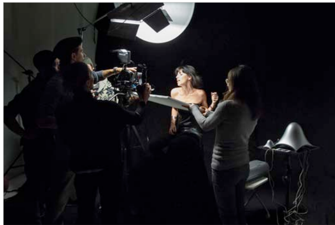
Riprese per video-clip musicale su fondo nero

Per rendere ancora più piacevole il lavoro all'interno dello studio Limbo negli ultimi mesi abbiamo creato una Sala Riunione e Relax .